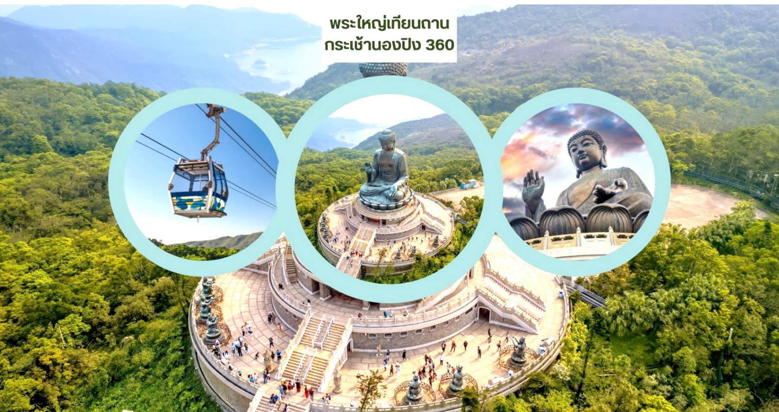
พระใหญ่เทียนถาน กระเช้านองปิง 360

จากนั้นนำท่านเดินทางสู่ เกะลันเตา สถานีตงซุง นำท่าน ขึ้นกระเช้านองปิง 360 (Ngong Ping 360) ชมวิวมุมกว้าง 360 องศา รวมค่ากระเช้า ตลอดระยะทางทั้งหมด 5.7 กิโลเมตร (ในกรณีทีกระเช้านองปิงปิด ทางบริษัทฯ ขอสงวนสิทธิ์นำท่านขึ้นชมโดยรถบัสแทน) นำท่านสักการะขอพร พระใหญ่เทียนถาน หรือ พระใหญ่เกะลันเตา ณ ลานอธิษฐาน พระพุทธรูปทองสัมฤทธิ์อันศักดิ์สิทธิ์ของฮ่องกง และเป็นพระพุทธรูปกลางแจ้งใหญ่ที่สุดในโลกองค์พระทำขึ้นจากการเชื่อมแผ่นทองสัมฤทธิ์กว่า 200 แผ่นเข้าด้วยกันหันพระพักตร์ไปทางด้านทะเลจีนใต้และมองอย่างสงบลงมายังหุบเขา และโชดหินเบื้องล่าง ให้ท่านชมความงดงามตามอัธยาศัย