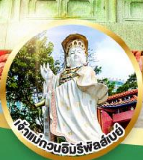
เจ้าแม่กวนอิมพรหมสักขี