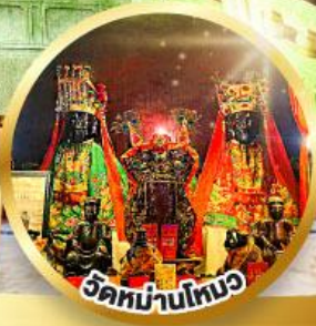
วัดหม่าไท่ทง

ขอพรเรื่องการศึกษา, การงาน สติปัญญาและความกล้าหาญ