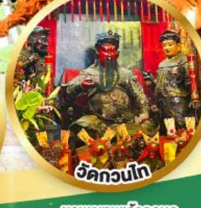
วัดกวนโก