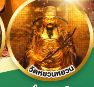
วัดหยวนหยวน

ขอพรเรื่องสุขภาพ, โชคลาภ ความเจริญก้าวหน้า