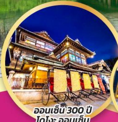
ออนเซ็น 300 ปี โตโจ ออนเซ็น