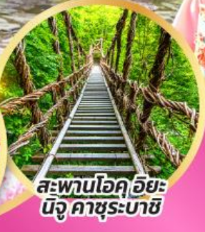
สะพานโอคุฮิยะ นิจู คาซุระบาชิ