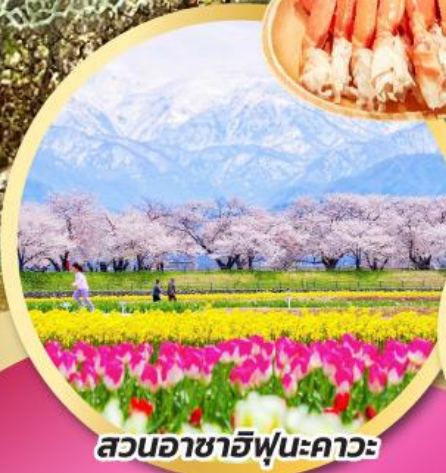
สวนอาซาฮิฟูเนะคาวะ