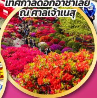
เทศกาลดอกอาซาเลีย ณศาลเจ้าเนสุ

ชมดอกไม้บานท่ามกลางเทือกเขาแอลป์ที่สวนอาซาฮิฟูเนะคาวะ