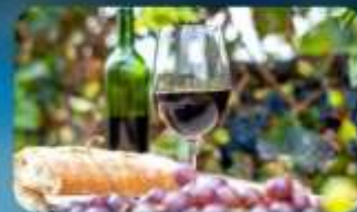
พิเศษ!! ซิมไวน์ท้องถิ่น