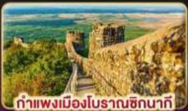
กำแพงเมืองโบราณชิกนากี