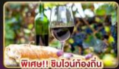
พิเศษ!! ซิมไวน์ท้องถิ่น