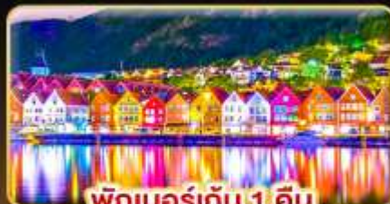
พักเบอร์เกน 1 คืน