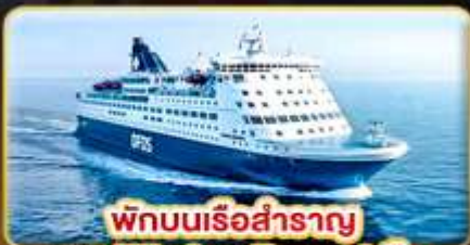
พักผ่อนเรือสำราญ แบบ Window Room 1 คืน

สัมผัสความเป็นที่สุดของ สแกนดิเนเวีย ให้ท่านได้พักผ่อนแบบ SLOW LIFE